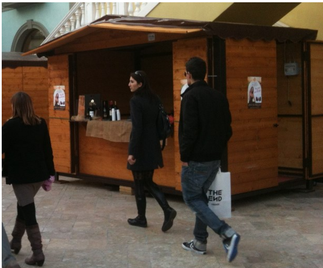
Utilizzo con piano di appoggio.