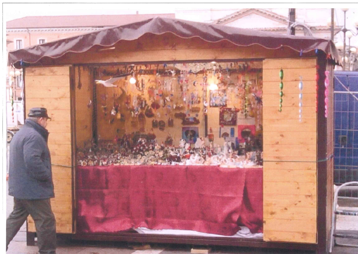
Utilizzo con tavolo interno.